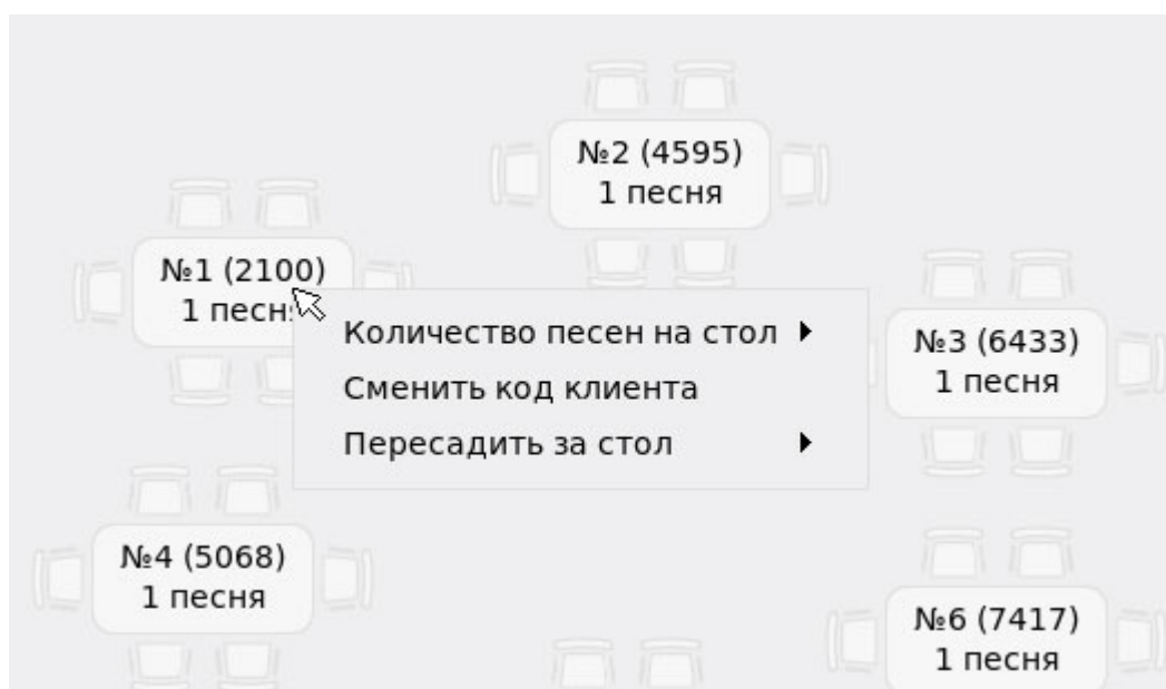
Рис. 3 Контекстное меню стола